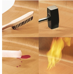
Tableau PAGHOLZ® indestructible, résistant aux rayures, à la rupture et aux chocs, et ignifuge.