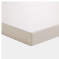
matériau du plateau en mélaminé avec chants robustes en plastique