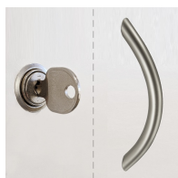
1 armoire OH avec poignée ou serrure