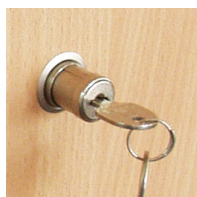
Portes coulissantes verrouillables