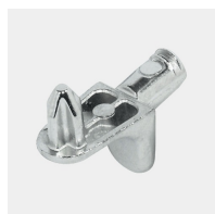
Supports d'étagères résistants à l'arrachement