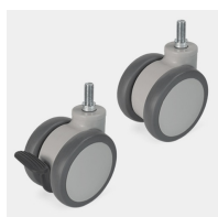
Mobile sur 4 roulettes dont 2 avec freins