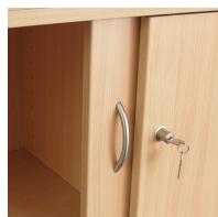
Portes coulissantes lissés