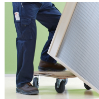
corps solidement chevillé et collé en usine