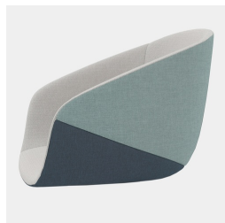
Qualité durable grâce à une fabrication de haute qualité