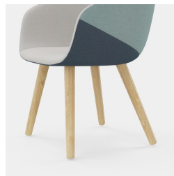
Cadre avec connexion de rangée