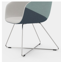
Y compris l'accoudoir avec revêtement softgrip noir