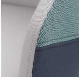
Qualité durable grâce à une fabrication de haute qualité