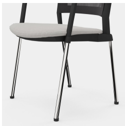
Cadre robuste en porte-à-faux