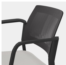
Dossier ergonomique en maille filet respirante