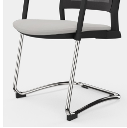
Cadre robuste en porte-à-faux