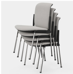
Jusqu'à 4 chaises empilables