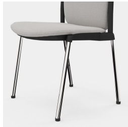
Cadre robuste en porte-à-faux