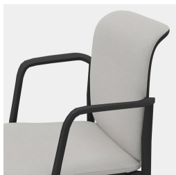
Dossier ergonomique en maille filet respirante