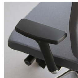
Réglage de la hauteur par ressort à gaz de sécurité