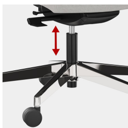
Cadre robuste en porte-à-faux