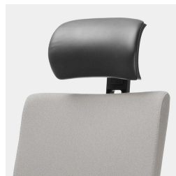
Réglage de la hauteur par ressort à gaz de sécurité