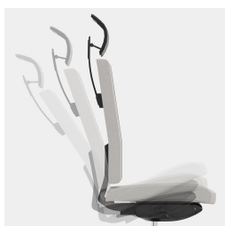
Cadre robuste en porte-à-faux