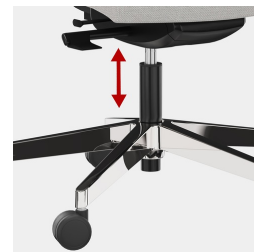
Cadre robuste en porte-à-faux