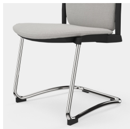
Cadre robuste en porte-à-faux