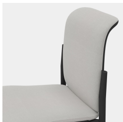
Dossier ergonomique en maille filet respirante