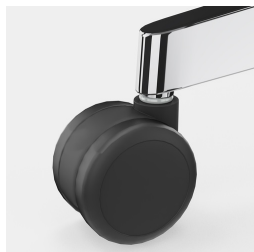
Réglage de la hauteur par ressort à gaz de sécurité