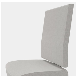
Réglage de la hauteur par ressort à gaz de sécurité