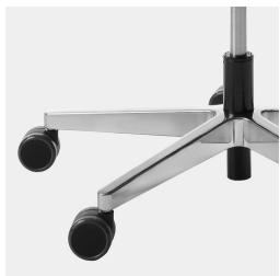
Réglage de la hauteur par ressort à gaz de sécurité