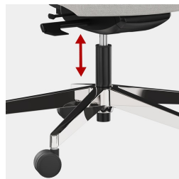
Cadre robuste en porte-à-faux