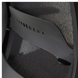
Dossier résille noir, avec réglage du soutien lombaire