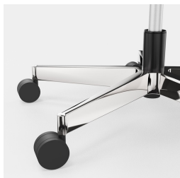
Réglage de la hauteur par ressort à gaz de sécurité