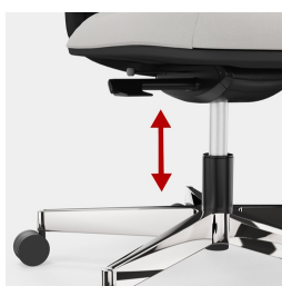
Cadre robuste en porte-à-faux