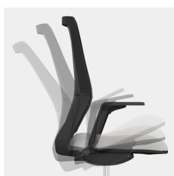
Cadre robuste en porte-à-faux