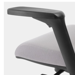
Réglage de la hauteur par ressort à gaz de sécurité