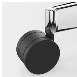
Réglage de la hauteur par ressort à gaz de sécurité