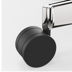
Réglage de la hauteur par ressort à gaz de sécurité