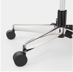
Réglage de la hauteur par ressort à gaz de sécurité