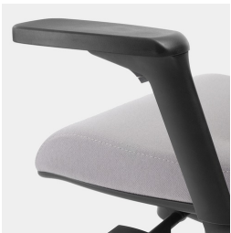
Réglage de la hauteur par ressort à gaz de sécurité