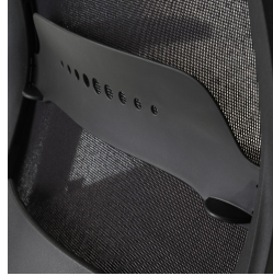
Dossier résille noir, avec réglage du soutien lombaire