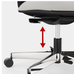
Cadre robuste en porte-à-faux