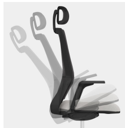
Cadre robuste en porte-à-faux