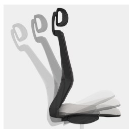
Cadre robuste en porte-à-faux