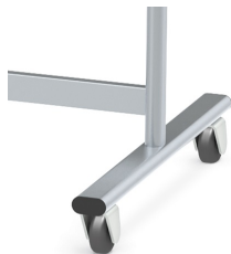
Table mobile sur 4 roulettes pivotantes robustes, dont 2 verrouillables

La surface d'écriture peut être tournée à 360° / peut être verrouillée dans n'importe quelle position.