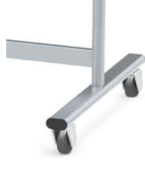
Table mobile sur 4 roulettes pivotantes robustes, dont 2 verrouillables

La surface d'écriture peut être tournée à 360° / peut être verrouillée dans n'importe quelle position.