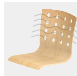
La coque du siège avec des découpes rondes assure une circulation d'air optimale.