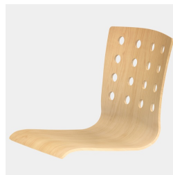
Coque de siège façonnée pour s'adapter au corps