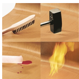
Assise et dossier revêtus de mélamine : résistants aux rayures, à la rupture et aux chocs, et ignifuges.