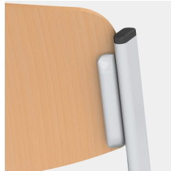
Assise et dossier vissés de manière invisible