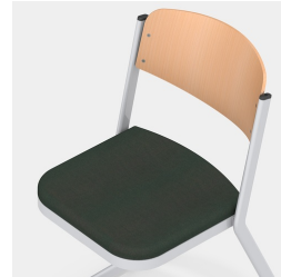
Avec coussin de siège