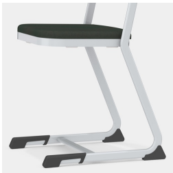
Cadre de patins en forme de C, stable et solide