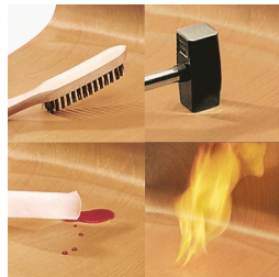
Assise et dossier revêtus de mélamine : résistants aux rayures, à la rupture et aux chocs, et ignifuges.