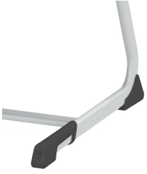
Protections de sol avec protection intégrée des marches