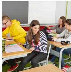
Il n'est pas nécessaire de déranger les pieds de la chaise pour s'asseoir ou se lever.