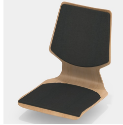
En option, avec coussin plat pour l'assise et le dossier