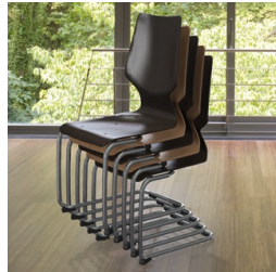
Empilable jusqu'à 5 chaises (sans rembourrage)