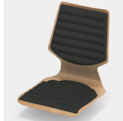
En option, avec un rembourrage de l'assise et du dossier en forme de vague.