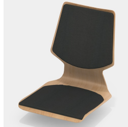
En option, avec coussin plat pour l'assise et le dossier