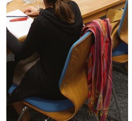
Le dossier particulièrement haut augmente le confort d'assise