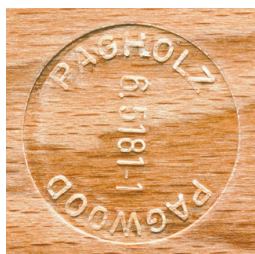
PAGHOLZ® issu de la sylviculture durable