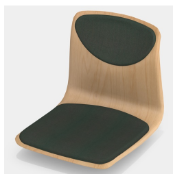
En option avec rembourrage de l'assise et du dossier (uniquement tailles 6E, 7)