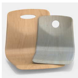
En option, avec trou de préhension, rond ou ovale (pas avec coussin de dossier)