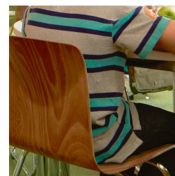
Forme de coque ergonomique et flexible