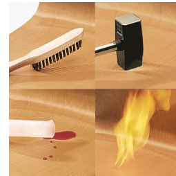
Coque indestructible en PAGHOLZ®, résistante aux rayures, aux chocs et aux flammes.