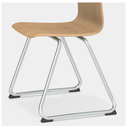
Cadre stable pour les patins