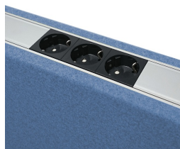
Ensemble électrique en option avec prise de courant à 3 voies avec mise à la terre