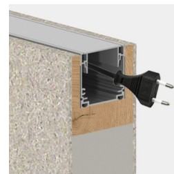
Y compris conduit de câbles pour le kit électrique en option