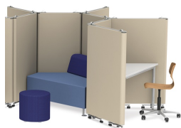
Zonage flexible de la pièce