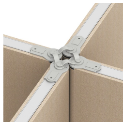
Jusqu'à quatre cloisons peuvent être reliés en un seul point