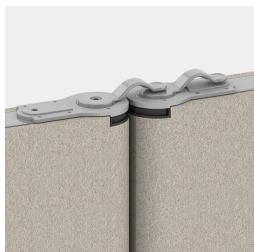
Élément de liaison breveté pour une liaison sans outils