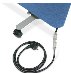
En option, avec un ensemble électrique