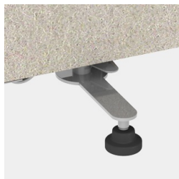
Stabilisateur rotatif avec pieds en plastique