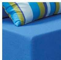
Confort maximal grâce au noyau en mousse et aux coins arrondis