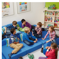
Utilisation polyvalente grâce à la fonction de pliage