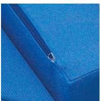
Couverture amovible avec fermeture éclair