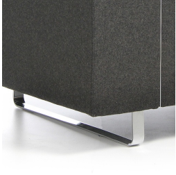
Cadre stable pour les patins