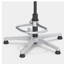
En option, avec un anneau de pied partiel