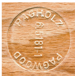
PAGHOLZ® issu de la sylviculture durable