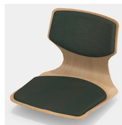
En option avec rembourrage de l'assise et du dossier (uniquement tailles 6E, 7)