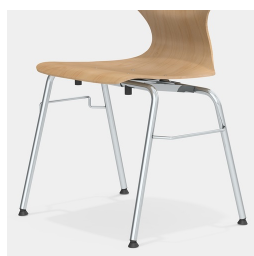
Cadre robuste à 4 pieds