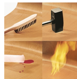
Coque indestructible en PAGHOLZ®, résistante aux rayures, aux chocs et aux flammes.