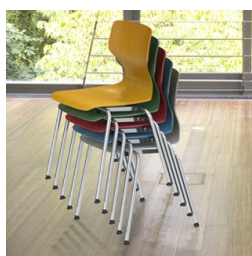
Empilable jusqu'à 8 chaises (sans rembourrage)