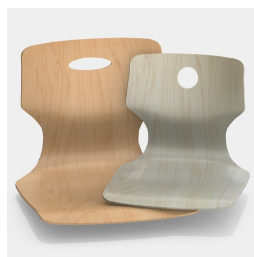
En option, avec un trou de préhension, rond ou ovale.