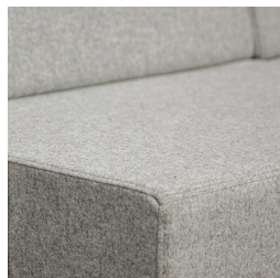
Qualité durable grâce à une fabrication de haute qualité