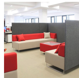
Extensible individuellement grâce à des éléments interconnectés