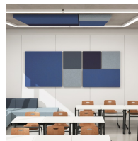
Unterschiedliche Größen und Stofffarben