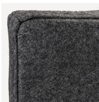
Saubere Befestigung mit stabiler Montageplatte, geschraubt