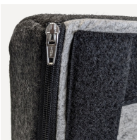
Abnehmbarer und waschbarer Bezugsstoff