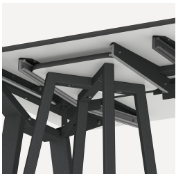
Halterung für FLEXLAB Hocker und Tidy Boxen