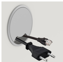
Optional mit seitlichem Kabeldurchlass