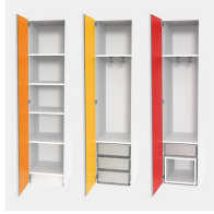
In 3 unterschiedlichen Ausstattungsvarianten