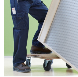
Korpus ab Werk fest verdübelt und verleimt für schnellen Aufbau vor Ort