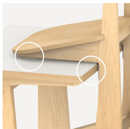
Schoner schützen Tischplatte beim Aufstuhlen