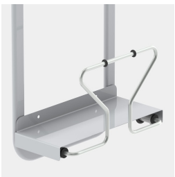
Einfach Befestigung des CPU-Halters mit Einlegeblech