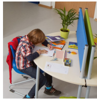
Ideal als Blick- und Schallschutz