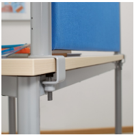
Montage mittels Inbusschraube an der Tischplatte