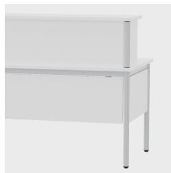
Elegante Optik: durchgehendes Tischbein

Unser Material- und Farbsortiment finden Sie in der ASS Materialübersicht.