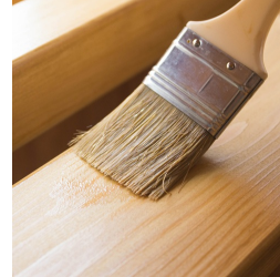
Umweltfreundlich mit Lack auf Wasserbasis lackiert.