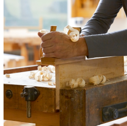
Massives Buchenholz aus nachhaltiger Forstwirtschaft