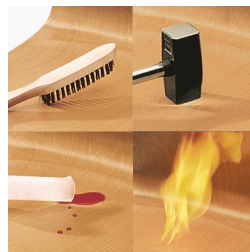
Unverwüestliche PAGHOLZ®-Schale, kratz-, bruch-, stoßfest und hitzebeständig