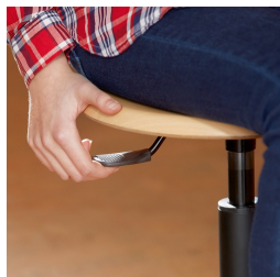
Höhenverstellung durch Sicherheitsgasfeder