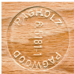
PAGHOLZ® aus nachhaltiger Forstwirtschaft