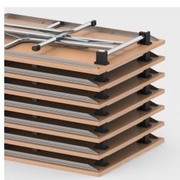
Bis zu 16 Tische stapelbar