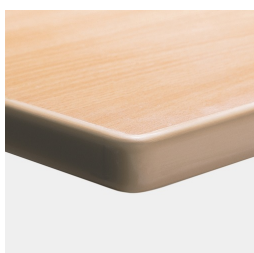
Optional Tischplatte melaminharzbeschichtet mit ASSODUR®-Kante